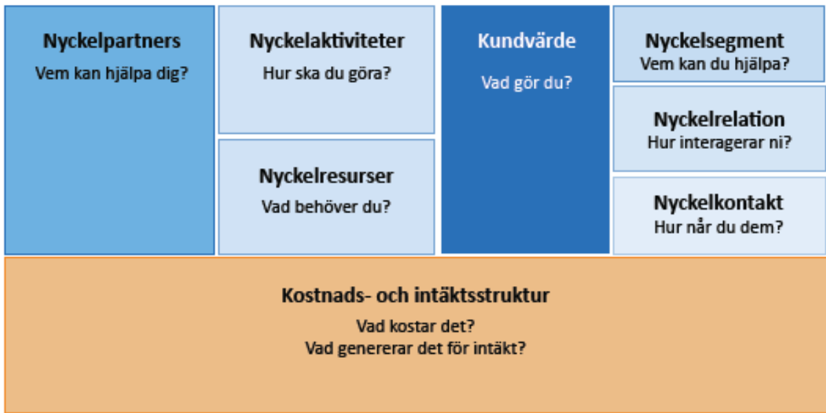
Figur 1 Business Model Canvas: en generell beskrivning av en affärsmodell [22]

I en studie av svenska fjärrvärmeföretags utmaningar att förändra sina affärsmodeller [6] togs en generisk bild fram av hur fjärrvärmens affärsmodell ser ut i Sverige idag. Den stämmer inte överens med utformningen av all fjärrvärmeverksamhet men ger en övergripande förståelse av hur affärsmodellen är uppbyggd och dess logik.